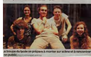
La troupe du lycée se prépare à monter sur scène et à rencontrer le public.

L'atelier théâtre se produira d'ici mai-juin, à 19 h 30, dans la salle de conférences du lycée de la mer, donne en outre trois représentations à destination des élèves : ce jeudi à 11 h 20 et 14 h 40, et demain à 14 h 40. La représentation durera une heure et l'entrée est libre. L'argument de la pièce est le suivant : un père élève seul ses deux adolescents, Chams et Solal. Il essaie de faire au mieux, mais ce n'est pas facile. L'un rêve d'études et d'aventures, l'autre découvre peu à peu le théâtre et la vie de saltimbanque.